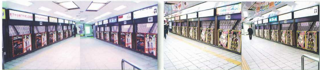
バイク/本田技研工業・フォルツァZ

交通広告と本誌の連動企画です。交通広告は表紙と連動させたビジュアルをサムライが制作。本誌内でも商品を出展することにより、幅広く訴求することが可能です。(写真はJR原宿駅明治神宮側改札通路にて)