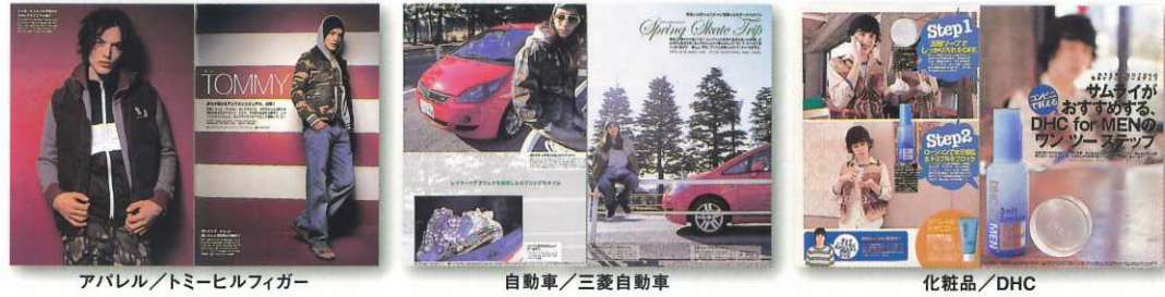
アパレル/トミーヒルフィガー

サムライマガジンのタイアップは、ブランド訴求だけにとどまりません。レスポンスを重視したものでインパクトあるページも企業側の要望にあわせてご提案をいたします。