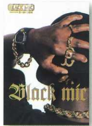
時計/カシオ計算機・G-SHOCK

本誌内に小冊子を貼り付ける企画です。もちろん増刷も可能ですので単体での販促物としてもご利用いただけます。(増刷は別途料金です。広告部までご相談ください。)