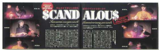
(写真はサムライマガジン6周年記念イベント「SCANDALOUS」)

サムライマガジンでは雑誌のほかに、ストリートカルチャーや読者と密接な関係があるクラブイベントにも力を入れております。また本誌との連動により、各企業のさまざまなプロモーション展開も実施することが可能です。